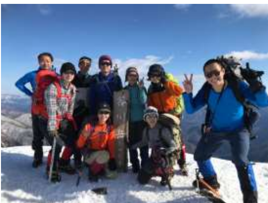
トマの耳で記念撮影